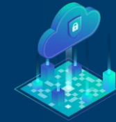
Ecosistema de Datos Cloud

Arquitectura de Alto Nivel de las soluciones