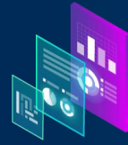
Business Intelligence & Ingeniería de Datos